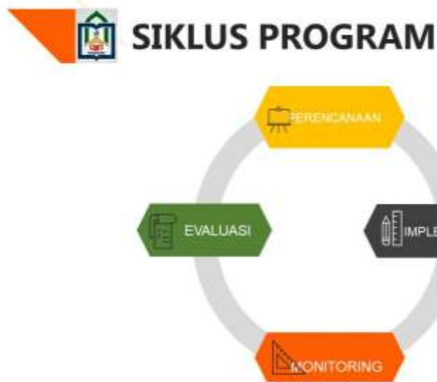
Gambar 1 Siklus Program